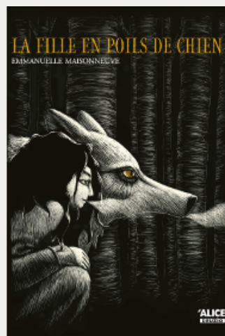
Illustration pour l'album «Il tavolino magico» [«La table magique», ndr], © Marameo Edizioni, 2019; couverture de l'album «Peter», © Salvioni Edizioni, 2021; couverture du roman «La fille en poils de chien», © Alice Jeunesse

Hannes Binder et Antoine Déprez: deux artistes différents, par l'âge, le style et les choix éditoriaux. Mais unis par la fascination de la carte à gratter, c'est-à-dire de la lumière surgissant du noir, rendue brillante par la force de la rayure, comme un geste unique, ici et maintenant, sans arrière-pensée possible. La rayure comme un instant irremplaçable pour créer de la beauté, une autre métaphore intense de la vie.