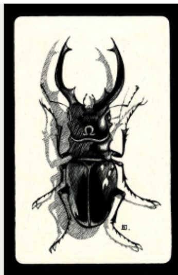
Proposition pour le concours d'affiches du Festival international du film de Locarno et «Cornabò», sujet pour une étiquette de vin (© Antoine Déprez)