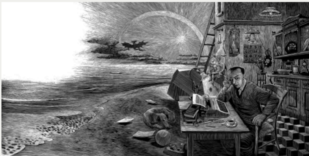
Illustrations de Hannes Binder tirées de «Fritz & Nanà», © 2023 Carthusia Edizioni